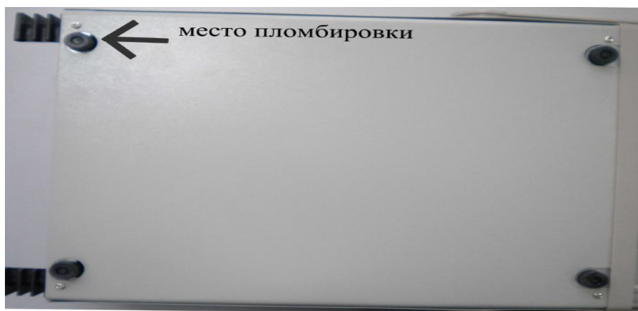
Рисунок 2 – Нижняя панель осциллографов